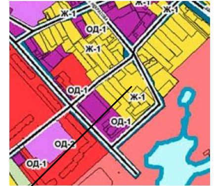
г. Алексеевка, ул. Некрасова, 75

Расположение земельного участка на карте градостроительного зонирования Правил землепользования и застройки Алексеевского городского округа