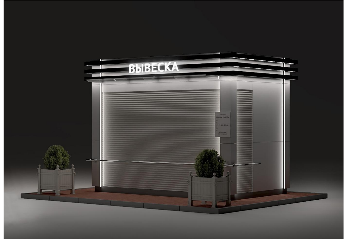
Киоск. Дневной и ночной виды